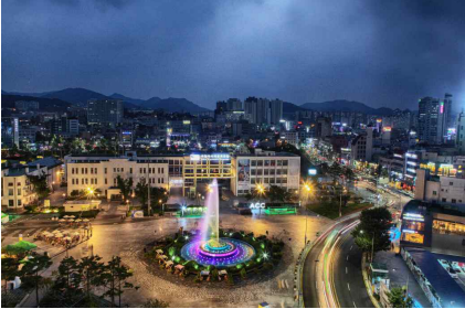
전일빌딩 245 전망대