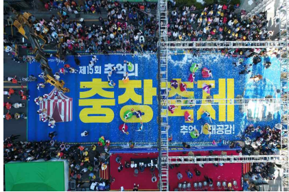
광주 추억의 충장축제