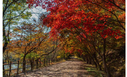
무등산 가을 산책로